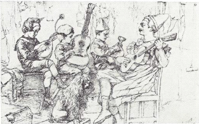
Tekening van Renz, ca. 1887.

Als eerste fase van dit project wordt de muzikale basisvorming van het jonge kind (tot 12 jaar) centraal gesteld.